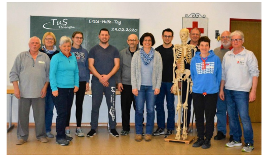
Erste – Hilfe – Tag 2020

Der Jahres- und Geschäftsbericht des Vorstandes war recht umfangreich. Seit der letzten Generalversammlung 2019 fanden insgesamt 11 Sitzungen des Gesamtvorstandes statt. Wesentliche Themen der Vorstandssitzungen waren : Erneuter Umzug der TuS-Homepage, Anpassung der Versicherungen, Förderverein TuS Teningen, Schlüssel und Schließanlage der Gemeinde, Lockdown Corona, Hygienekonzept, Neuwahl Schriftführer/in, sowie zwei neue Kassenprüfer, Erste-Hilfe-Kurs für Trainer & Übungsleiter.