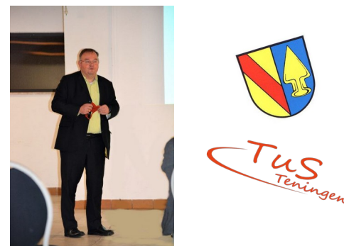
Bürgermeister Heinz-Rudolf Hagenacker