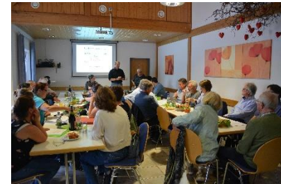
Vereinsheim TuS Teningen

Weitere Punkte waren u.a. die Anpassung und Aktualisierung der Stammdaten, Anmeldung bei Neumitgliedschaft nach Einzug. Ein Antrag beim Kinderschutzbund in Arbeit, um auch weiter Zuschüsse beantragen und genehmigt zu bekommen, da jeder Verein der Kinder im Verein hat, braucht in Zukunft ein solches Kinderschutzsiegel. Die Aufteilung der „Arbeitseinsätze Vereinsheim“ funktioniert gut und wechselt zu jedem Halbjahr.