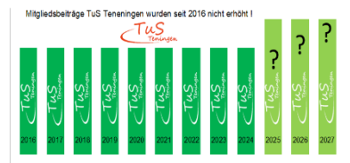
Aufgrund des Mitgliedsbeitrages, besteht ab 2025 die Möglichkeit, die Mitgliedsbeiträge bei Bedarf zu erhöhen. Sollte kein Bedarf bestehen, kann die Erhöhung entsprechend ausgesetzt werden, am bei Bedarf dann, entsprechend schnell reagieren zu können.

Seit 2016 wurden die Beiträge nicht erhöht. Derzeit ist der TuS Teningen im Umkreis, der günstigste Mehrsparten Sportverein. Um die gestiegenen Kosten langfristig decken zu können, sollten die Beiträge ab 2025 leicht angehoben werden.