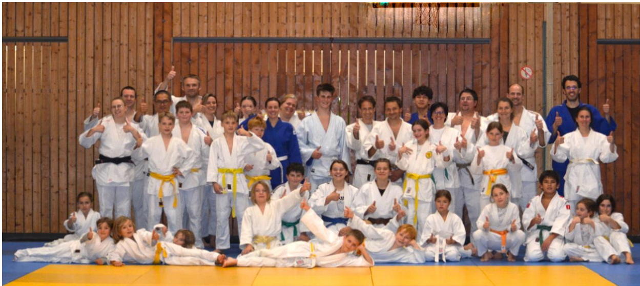
<< Eltern-Kinder Judo >> Klein mit Groß – Auf los ging's los